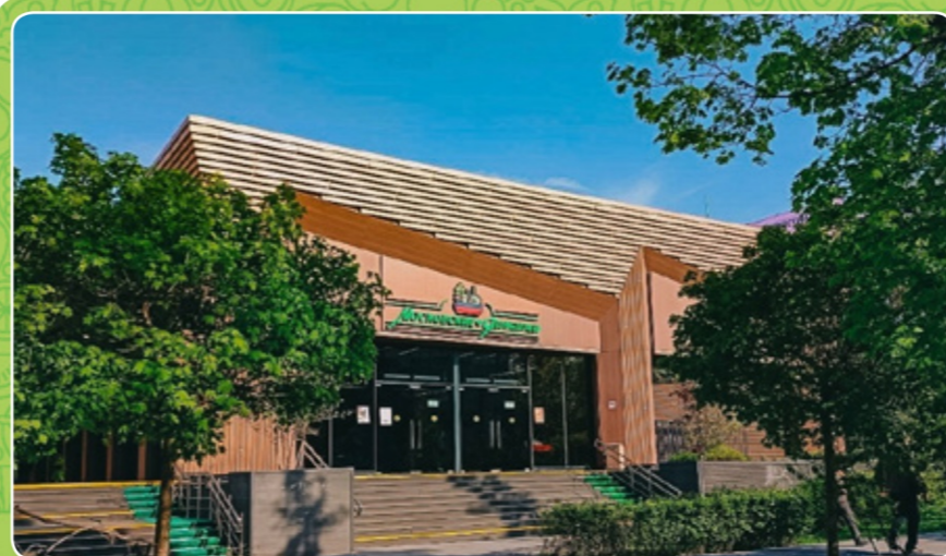
СТИЛЬ «ФЕРМЕРСКАЯ ЯРМАРКА»

ЦАО, Арбат, Б. Николопесковский пер., вл. 8 ЦАО, Басманный, Бакунинской ул., вл. 24 САО, Дмитровский, пересечение Дмитровского ш. и ул. Лобненская САО, Савеловский, Нижняя Масловка ул., вл. 2 САО, Бескудниковский, Бескудниковский бульвар, вл. 59 СВАО, Бутырский, Милашенкова ул., вл. 14 СВАО, Ярославский, Ярославское шоссе, вл. 111 СВАО, Отрадное, Алтуфьевское шоссе, вл. 30Г СВАО, Отрадное, Отрадная ул., вл. 16 СВАО, Южное Медведково, Полярная ул., вл. 10 ВАО, Перово, Зелёный пр-т, вл. 2 ВАО, Вешняки, Кетчерская ул., вл. 4Б (напротив) ВАО, Ивановское, Челябинская ул., вл. 15 ЮВАО, Кузьминки, Юных Ленинцев ул., вл. 52 ЮВАО, Рязанский, Академика Скрябина ул., вл. 4 ЮАО, Орехово-Борисово Северное, ул. Домодедовская, вл. 12 ЮАО, Бирюлево Восточное, Михневская ул., вл. 9/1 ЮАО, Царицыно, Пролетарский пр-т, вл. 24 ЮАО, Бирюлево-Западное, Булатниковский проезд, вл. 14 ЮАО, Чертаново Южное, Россошанский пр-д, вл. 8, к. 2 ЮАО, Зябликово, Ореховый бульвар, вл. 24 ЮЗАО, Черемушки, Профсоюзная ул., вл. 41 ЗАО, Раменки, Раменки ул., вл. 3 ЗАО, Фили-Давыдково, Ватутина ул., вл. 18, к. 2 ЗАО, Можайский, Барвихинская ул., вл. 6 ЗАО, Ново-Переделкино, Чоботовская ул., вл. 1 ЗАО, Очаково-Матвеевская, Матвеевская ул., вл. 2 СЗАО, Хорошово-Мневники, Саляма Адила ул., вл. 4 СЗАО, Южное Тушино, Свободы ул., вл. 57